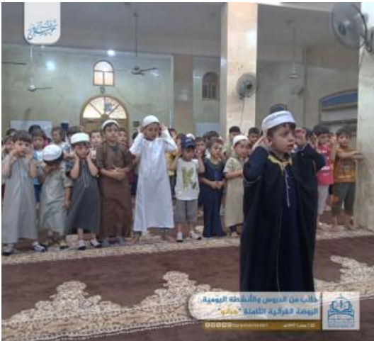
תפילה באחד מגני הילדים (פרסום: 16.08.2025)

תכנית הלימודים האוניברסלית (כמו בבתי הספר הציבוריים בסוריה) נכנסה גם היא לתוכנית הלימודים ברשת בתי הספר "דאר אל-וחי א-שריף", אם כי רק בנוסף לשיעורי הדת - כלומר, הקוראן הוא עדיין המקצוע הראשי בתוכנית הלימודים, כפי שאומר הסלוגן של הרשת: "לקראת דור קוראני ייחודי" (نحو جيل قرآني فريد).