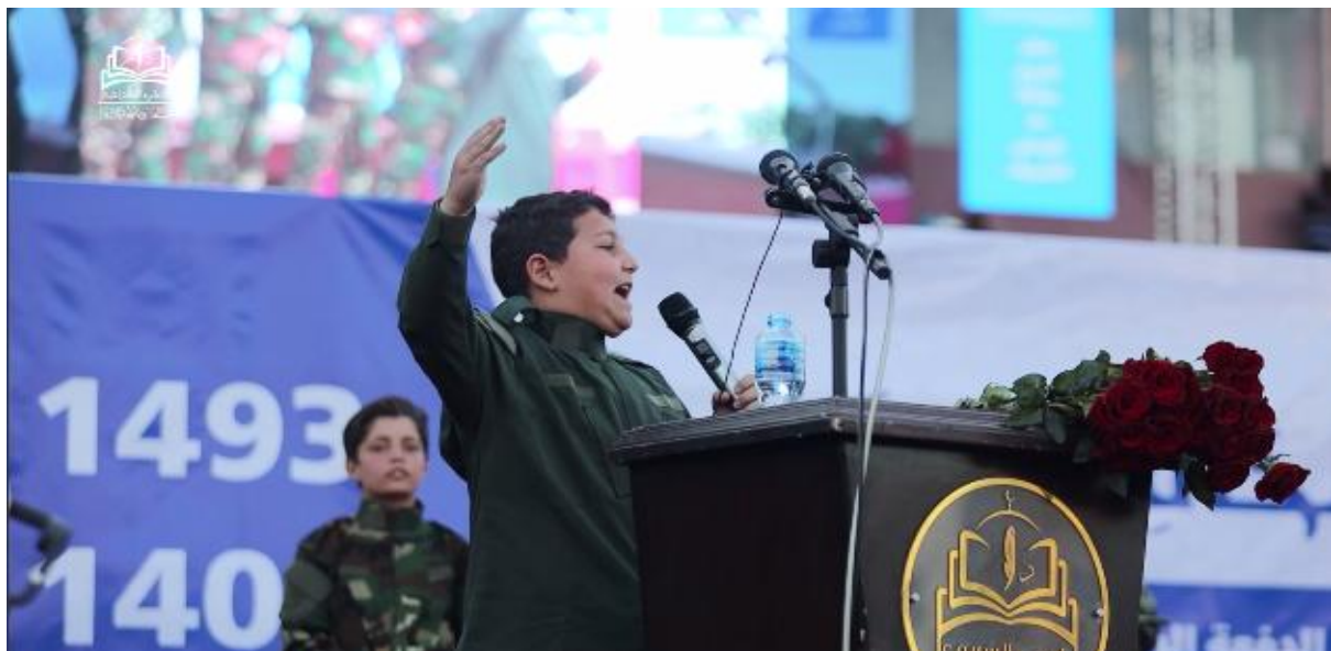
תלמיד נושא דרשה מול קהל (פרסום: 11 במאי 2025)