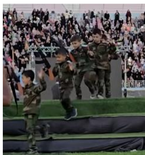
מימין: תלמידים לבושים מדי צבא ואוחזים ברובה מפלסטיק. משמאל: תלמידים נושאים את חבריהם כגופות שהידיים (פרסום: 25.09.2025)