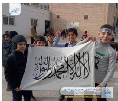
HTS תלמידים עם דגל וסרט ראש של (פרסום: 15.12.2025)

רשת "דאר אל-וחי א-שריף" (دار الوحي الشريف - בתרגום לעברית: בית ההתגלות הנכבדת; ובתרגום לאנגלית: The house of the Honored Revelation) היא רשת חינוך של נכון להיום בתי ספר יסודיים וגני ילדים איסלאמיסטיים השייכת לארגון של אחמד א-שרע בסוריה – "היאית תחריר א-שאם" (هيئة تحرير الشام - HTS).