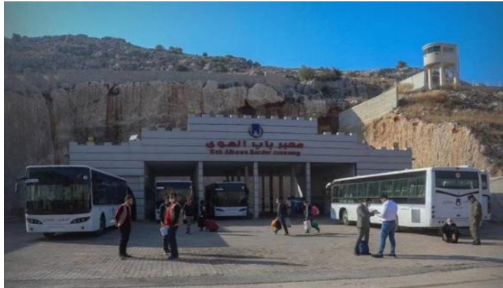
מעבר הגבול "באב אל-הווא" בין סוריה לטורקיה, שדרכו עבר המימון לבתי הספר באידליב

באידליב, מודל המימון של "דאר אל-וחי א-שריף" התבסס בעיקר על תרומות ועל מימון חיצוני טורקי, מעבר למיסים שגבה ארגון "היאית תחריר א-שאם" מהתושבים. דווח כי המימון הטורקי הגיע פיזית דרך מעבר הגבול "באב אל-הווא" (باب الهوى) וכיסה חלק משכר המורים ומהוצאות התפעול של בתי הספר. אך כיום, לאחר עליית משטרו של א-שרע, ייתכן שהמימון מגיע ישירות מתקציב המדינה - עם הפיכת "דאר אל-וחי א-שריף" למוסד רשמי וחוקי תחת משרד החינוך הסורי.