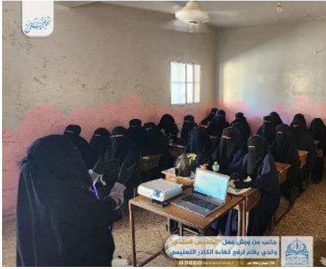
גם בתוך הכיתות, הבנות לובשות ניקאב שמכסה את הראש לחלוטין (פרסום: 22 באוגוסט 2024)

בתי הספר מתנהלים כמצופה בחברה שרעית - בחוקי לבוש דתיים מחמירים ובהפרדה מגדרית מוחלטת, גם ברמת התלמידים וגם ברמת המורים. כלומר, בבתי הספר ישנה הקצאת מורים גברים לתלמידים ומורות נשים לתלמידות, ובתי הספר מבוססים על תלבושת אחידה (בעיקר לבנות) המחולקת בחינם.